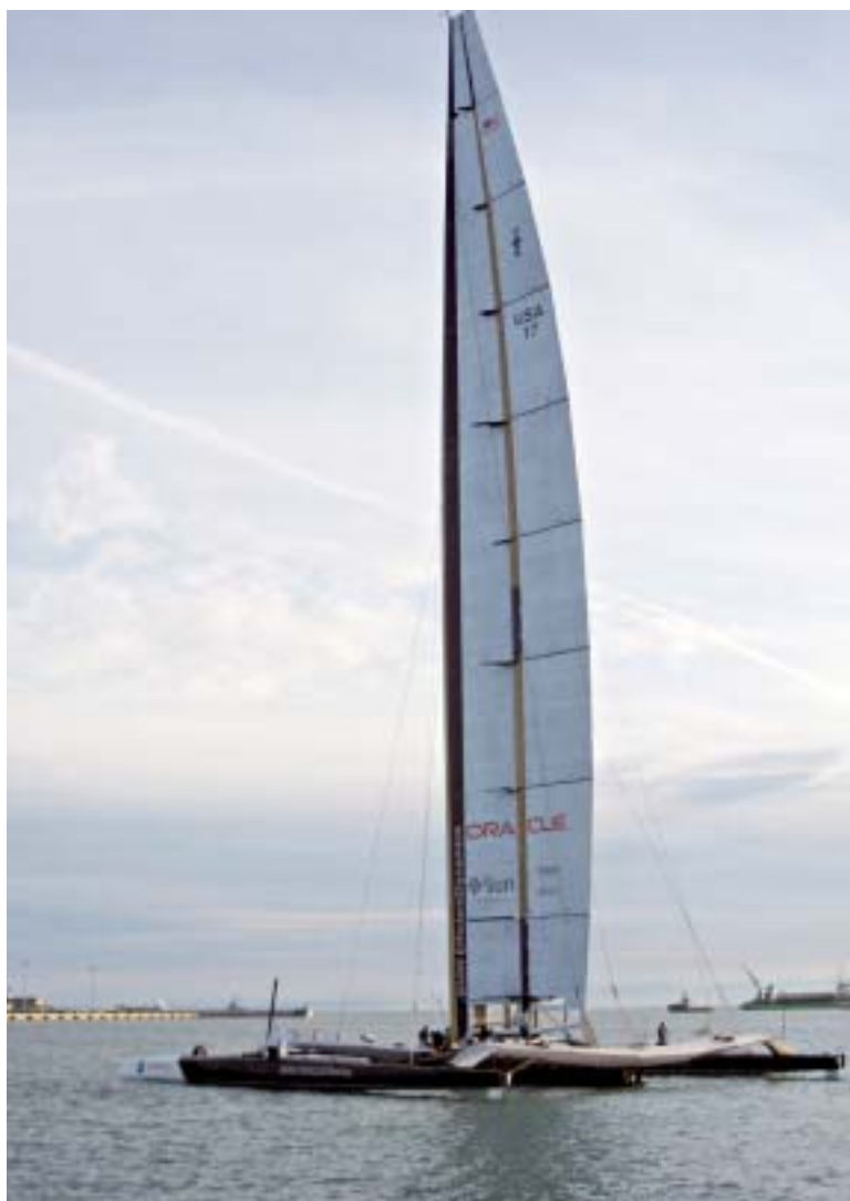
La possente struttura del grande avversario di Alinghi, il trimarano Oracle Racing , evidenzia il suo punto di forza: il grande albero a profilo alare alto quasi 70 metri, comandato da 9 flaps asserviti ad un sistema idraulico e computerizzato

Prima della partenza dagli Stati Uniti Dennis Conner, che la coppa l'aveva vinta con un catamarano nel 1988, aveva prestato allo squadrone americano il gigantesco bandierone usato quel-