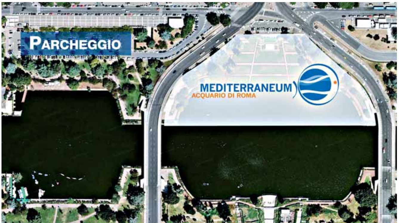
L'area di sviluppo del progetto Mediterraneo nell'area del laghetto dell'EUR, a Roma, con, a fianco, quella per i servizi logistici; nelle pagine a seguire, alcune immagini virtuali su come si presenteranno al pubblico i locali dell'acquario

Un grande sogno si realizzerà celebrando un grande evento: i 150 anni dell'Italia!!!